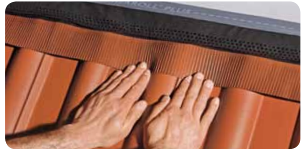
c.) Dank der hohen Dehnbarkeit erleichtert Figaroll Plus ein exaktes und leichtes Anformen, auch bei stark profilierten Dachpfannen.