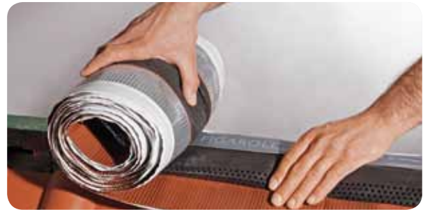
a.) Figaroll Plus exakt an First oder Grat anlegen und ausrollen.