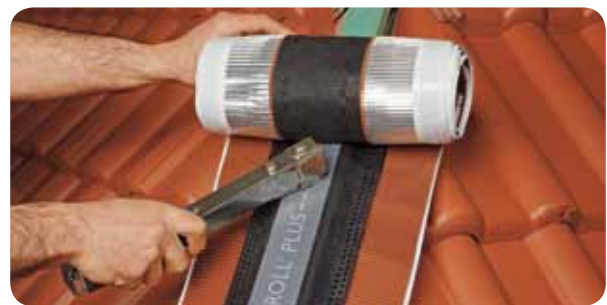
b.) Figaroll Plus durch den Nagelstreifen auf der First- oder Gratlatte befestigen.