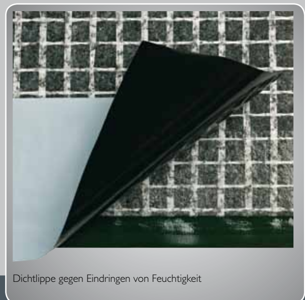
Dichtlippe gegen Eindringen von Feuchtigkeit